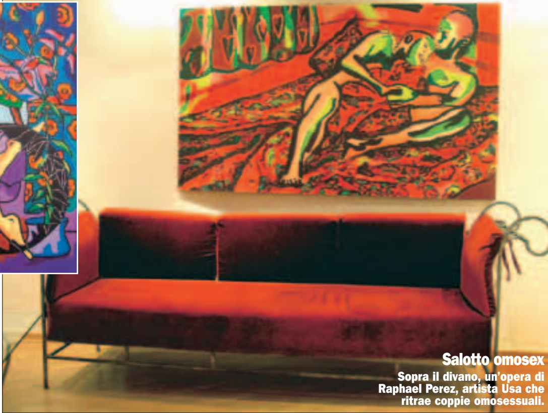
Salotto omosex Sopra il divano, un'opera di Raphael Perez, artista Usa che ritrae coppie omosessuali.