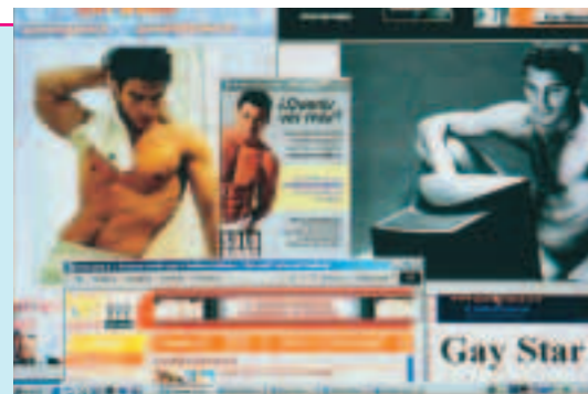
Pagine web tratte da siti dedicati ai gay.

per cui viene il desiderio... anche solo di toccare la mano dell'altro. Pinco. Sì. Pallino. Come cavolo si fa? In pubblico? Pinco. Non si fa è chiaro. Quello si fa solo in privato. Pallino. Penso che tu abbia ragione sigh.