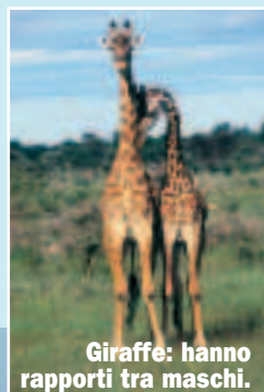
Giraffe: hanno rapporti tra maschi.

Giochi erotici "omo" tra due balene grigie.